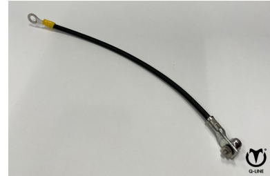
Schrikstroom kabeltje klem