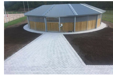
Passage 12 meter 750N