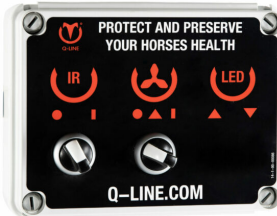
Bediening CB IR AB 400