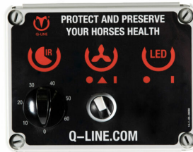
Bediening MT IR AB 400