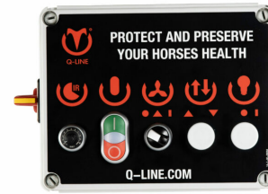
Besturing ET-IR AB 400