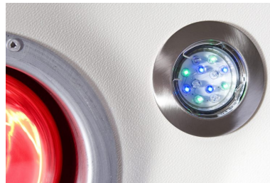
12 RGB LED