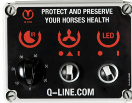
Bediening MT IR AB L 400