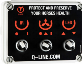
Bediening CB IR AB L 400