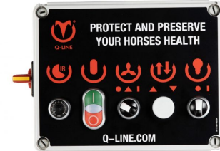
Besturing ET-IR AB, L 400