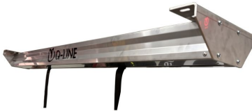
Electrische Lift 170 Extreme Duty