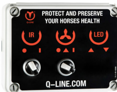
Image not found Inclusief kabels