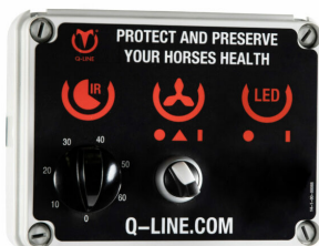
Image not found Inclusief kabels

De ventilatoren worden bediend met een 3 standen schakelaar waarmee ze uit, automatisch of constant geschakeld kunnen worden.