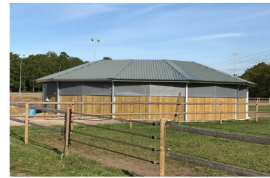
Passage 15 meter 750N