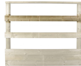
Planken 16 meter molen