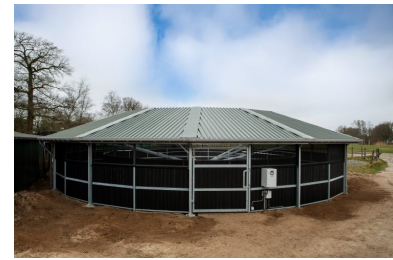
Passage 20 meter 750N