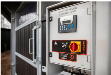
Programmeerbare kast 230V-0,75KW