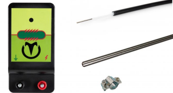
Schrikstroomset Basic 230