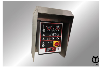
Beschermkap voor kast