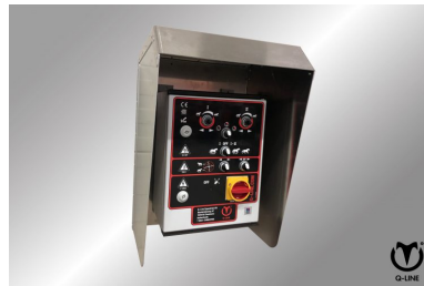
Beschermkap voor kast