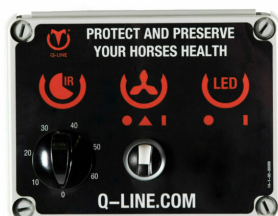
Image not found Inclusief kabels