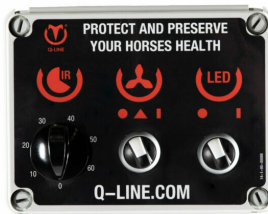
Image not found Inclusief kabels