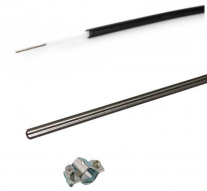
Schrikstroomset Basic 230