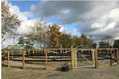
Basic XL Omheining 18,6 mtr