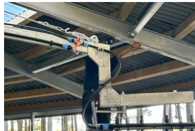
Longeer beregening op 1 arm