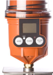
USD Smeersysteem Sublime