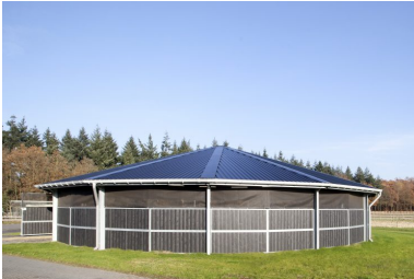
Dome 20 meter 1500N