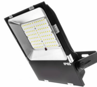
LED lamp 150W Basic