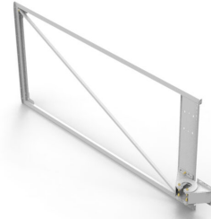
Poort 3 panelen