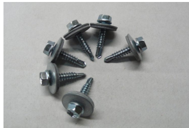
Bevestiging voor staal