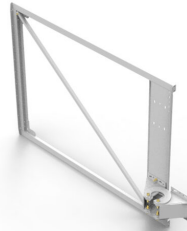
Poort 2 panelen