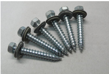
Bevestiging voor hout