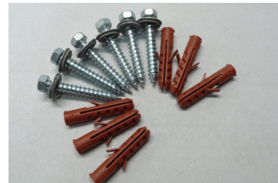
Bevestiging voor muur of beton