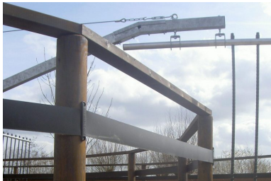
Image not found Paardvriendelijk