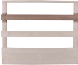
Planken 25 meter molen