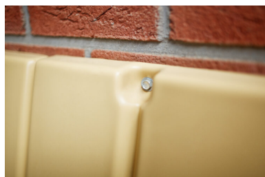
Image not found Watervast type unknown