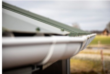
Regengoot 14 secties