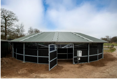
Omheining 20 meter overkapping