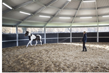
Longeeromheining 15 meter overkapping