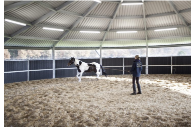
Longeeromheining 20 meter overkapping