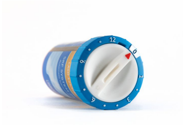
Image not found Geen chemisch afval