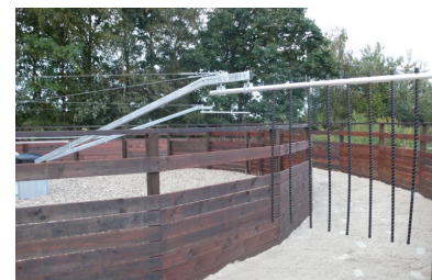
Image not found Slagvast unknown