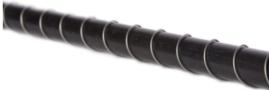
Safety Flex spijl 200