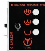
Munzgerät 230 € 1