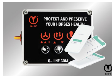
Zahlen mit Handy 230