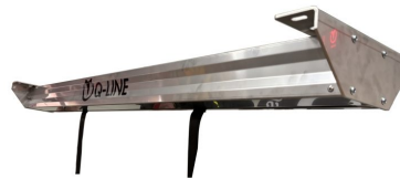
Elektrische Hebeeinheit 170