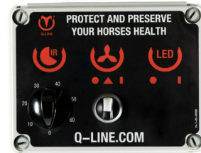
Bedienung MT IR AB 230