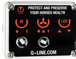
Bedienung CB IR AB 230