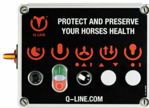
Steuerung ET-IR AB 230