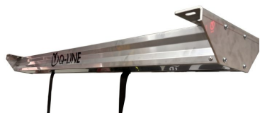
Elektrische Hebeeinheit 170 Extreme Duty