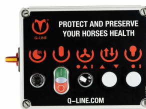
Steuerung ET-IR AB 400