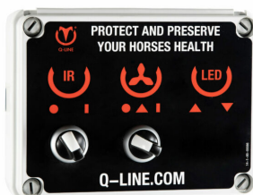
Bedienung CB IR AB 400