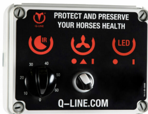
Image not found Einschließlich Kabel