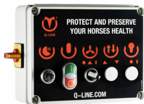
Image not found Einschließlich Kabel