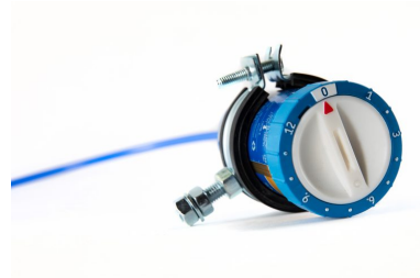
Smiersystem 12 Monate