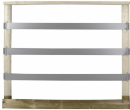
Bretter 15,8 mtr