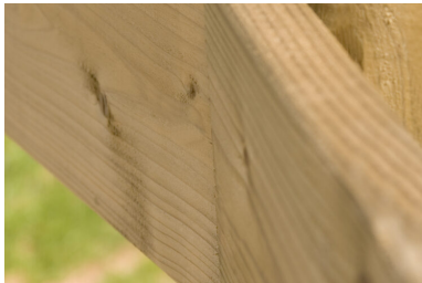
Image not found Grün imprägniert