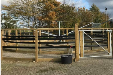
Basic Führanlage Zaun 15,8 mtr