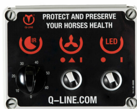
Image not found Einschließlich Kabel