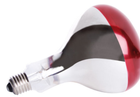
Image not found Lange Lebensspanne