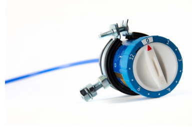
Smiersysteem 12 Monate