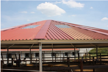
Dome 18 meter 1500N