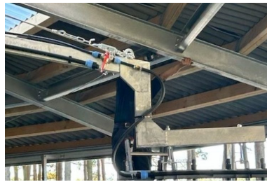
Longier beregnung auf 1 arm