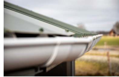
Regenrinne 11 Abschnitte