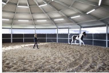
Longier umzäunung 18 meter Überdachung