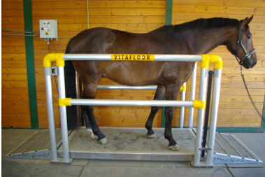
Halterungssystem für VME