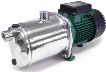
Pop up pompset Sublime