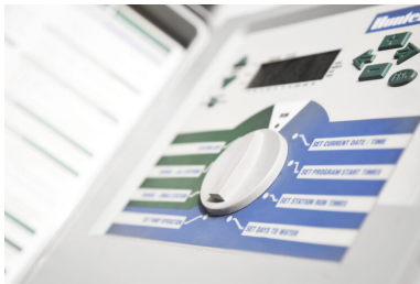
Image not found Verbesserte Abwassertoleranz

Image not found Düsen voll einstellbar 50-360gr