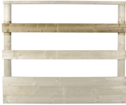
Planken 12 meter molen